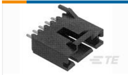
TE 产品编号5-104809-4 05 MTE HDR SRST LATCH W/HLDWN