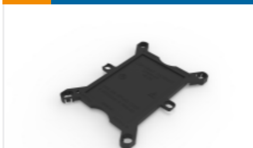
TE 产品编号2305234-1 SOCKET P HARDWARE DUST COVER