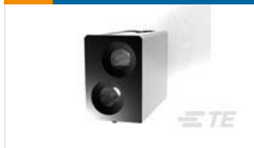
TE 产品编号3-1469373-7 ATCA GUIDE MODULE RA FEMALE