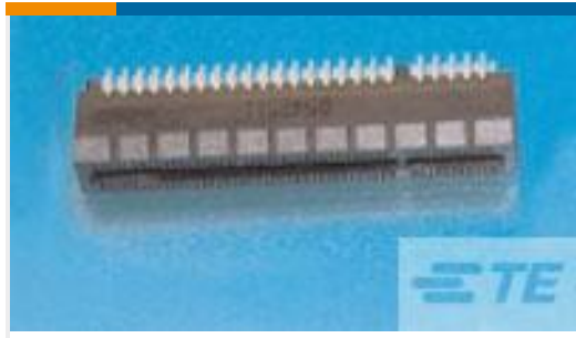
TE 产品编号1871058-3 PCI EXPRESS CONN. EON TYPE, 98