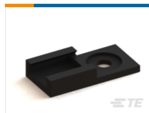
TE 产品编号ZPF00000000137792 PANEL MOUNTING CLIP