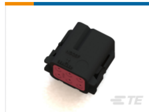
TE 产品编号ZPF00000000136482 FEMALE PLUG 6POLES S.6 W/O CT