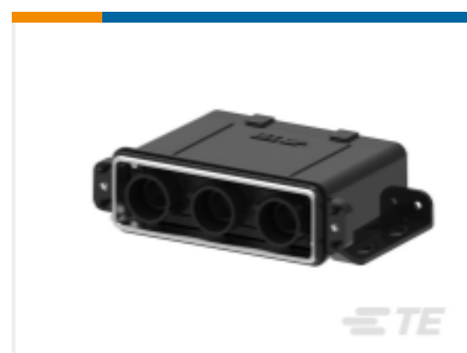
TE 产品编号ZPF00000000200448 RECEPTACLE STRAIGHT 3X CAL 12 SIZE 1