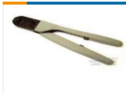
TE 产品编号91565-1 CCII D-3 S REC TAB 28-24 ASSY