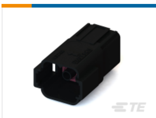
TE 产品编号ZPF00000000136481 RECEPTACLE MALE FOR 4 PINS, CAL 1,6