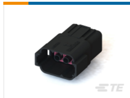
TE 产品编号ZPF00000000136483 RECEPTACLE MALE FOR 6 PINS, CAL1,6