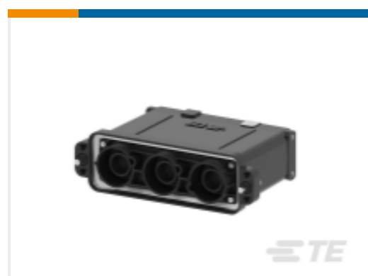
TE 产品编号ZPF00000000200449 PLUG STRAIGHT 3X CAL 12 SIZE 1