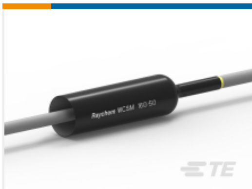
TE 产品编号CU4622-000 厚壁热缩管