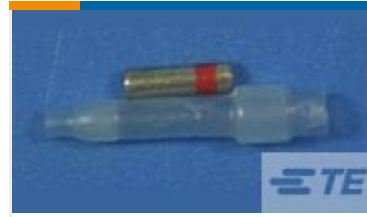
TE 产品编号664681-000 D-609-07CS2603