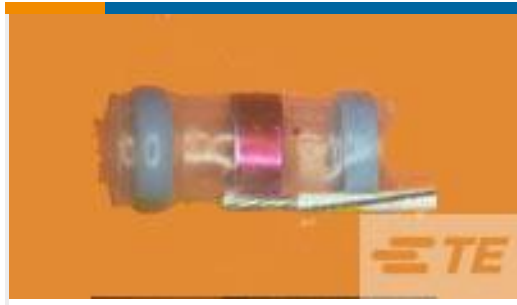
TE 产品编号974559N002 S02-08-R-3CS816