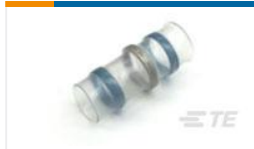
TE 产品编号257509N002 S02-10-R-6CS816