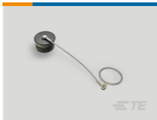
TE 产品编号YDTS32F13RV0010000 DTS CAP ASSY, NICKEL, SIZE 13 PLUG