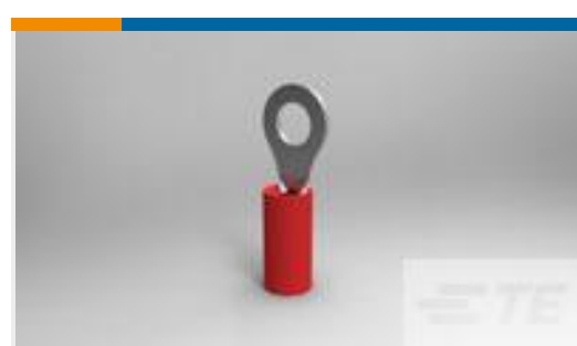
TE 产品编号320551 PIDG R 22-16 COMM 22-18 MIL 8