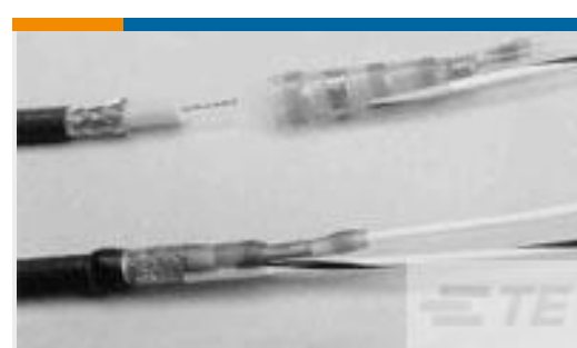
TE 产品编号644529-000 CWT-4174-W122-5/9