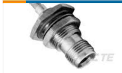
TE 产品编号1057679-1 3104 7985 00