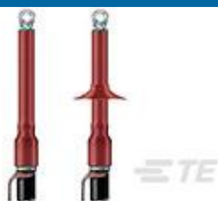
TE 产品编号CF6349-000 IXSU-F3121-ML-1-13