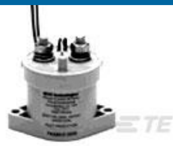
TE 产品编号1-1618002-8 EV200HAANA=RELAY, SPST-NO WITH