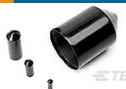
TE 产品编号843036-000 101A031-3-0