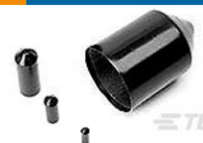
TE 产品编号843052-000 101A052-3-0