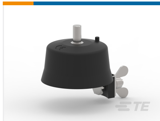
TE 产品编号E08692-000 LVA-280B-AS