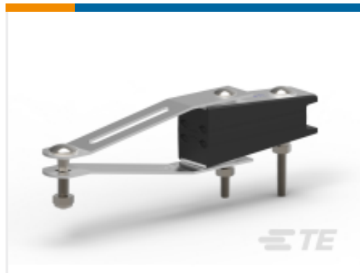
TE 产品编号2832095-2 PA4X50-95 (120) MA