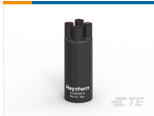
TE 产品编号C52918N001 502K016/S(S5)