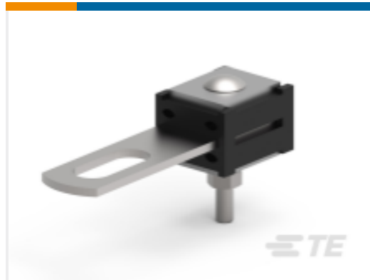
TE 产品编号707352-000 HEL-3909