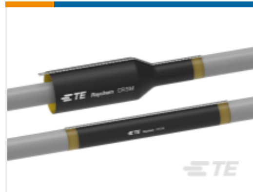
TE 产品编号651087-001 CRSM-107/29-750/S(S6)