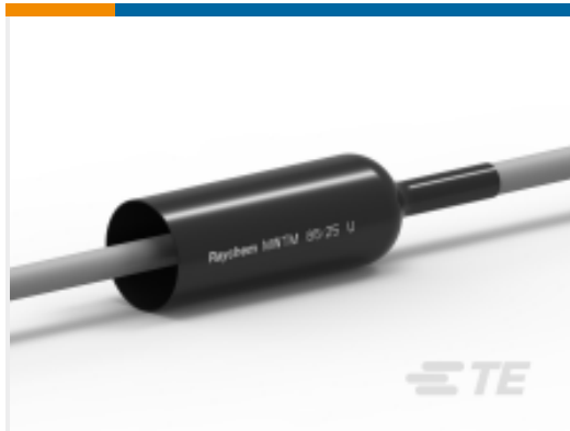
TE 产品编号917867-000 MWTM-85/25-1000/U(S5)