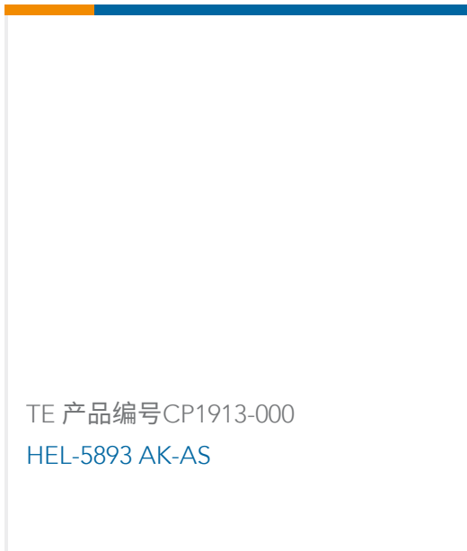
TE 产品编号CP1913-000 HEL-5893 AK-AS