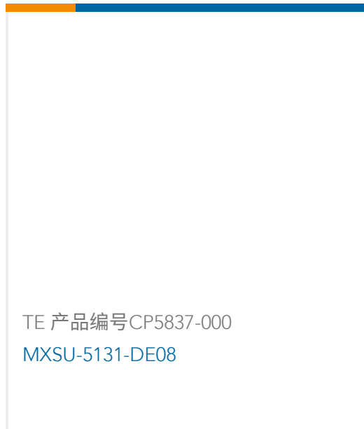
TE 产品编号CP5837-000 MXSU-5131-DE08