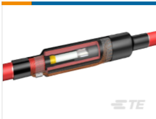
TE 产品编号CA7352-005 MXSU-5151