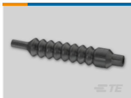
TE 产品编号806235-000 缠绕热缩单管护套：有嘴，直形