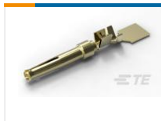
TE 产品编号166051-1 24-20 AWG HD-20 SOCKET