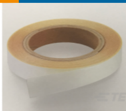
TE 产品编号 890060-000 S1017-1.0X50