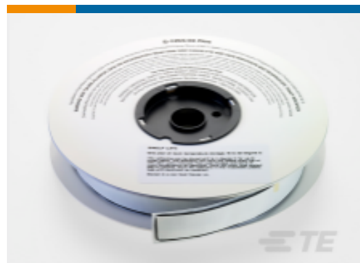
TE 产品编号 195133-000 S1255-04-3/4X100FT