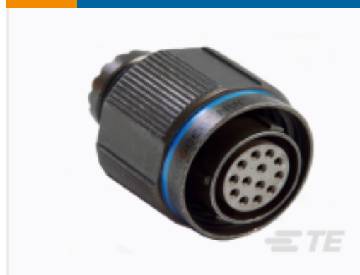
TE 产品编号YDTS26F19-32SNV001 PLUG ASSY