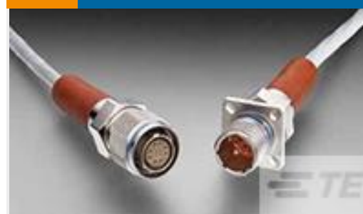
TE 产品编号YCFX20W1108PZN0000 RECP ASSY