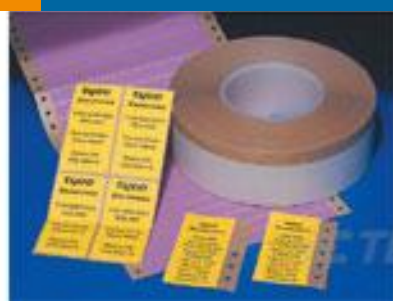
TE 产品编号318606-000 TTVF075YW-100