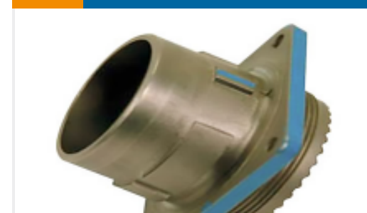
TE 产品编号YDIV46E13-35SNC009 PLUG ASSY