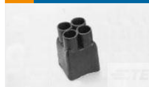
TE 产品编号615970-001 F-23-FR