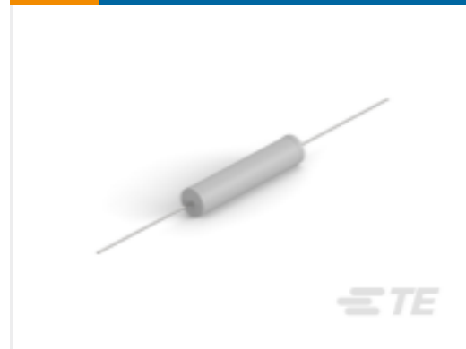
TE 产品编号2-2176415-9 8W STD M/OX 5% 430R