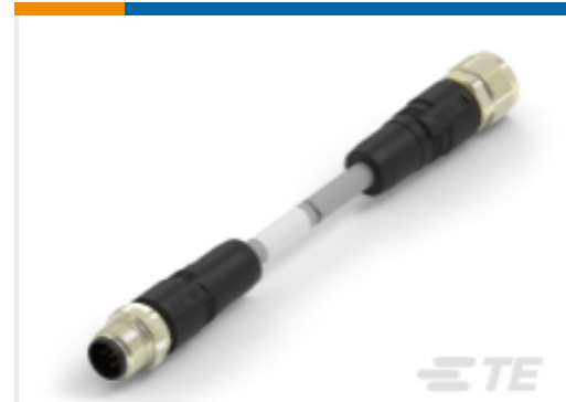
TE 产品编号TAA755A1611-080 M12A5-MS-FS-PVC-8.0M