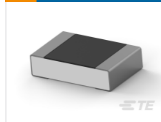
TE 产品编号4-2176374-5 RQ 0805 309R 0.1% 10PPM 1K RL