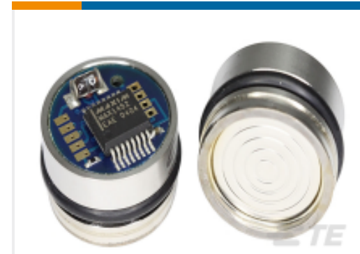
TE 产品编号86A3R-000000-100PG 100 PSIG ANALOG PRESSURE SENSOR