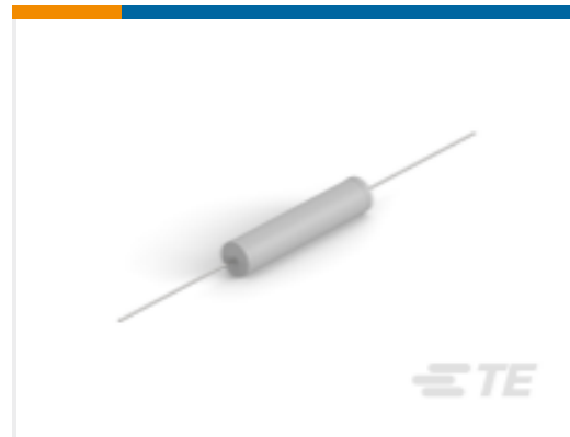
TE 产品编号2-2176415-9 8W STD M/OX 5% 430R