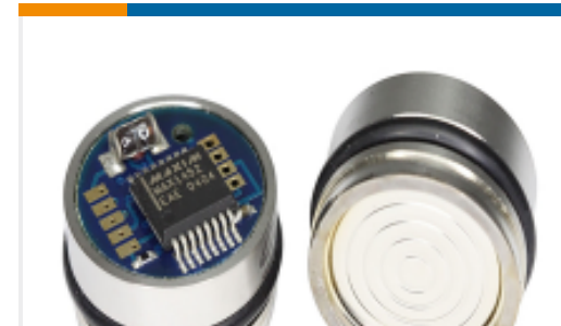
TE 产品编号86A3R-000000-100PG 100 PSIG ANALOG PRESSURE SENSOR