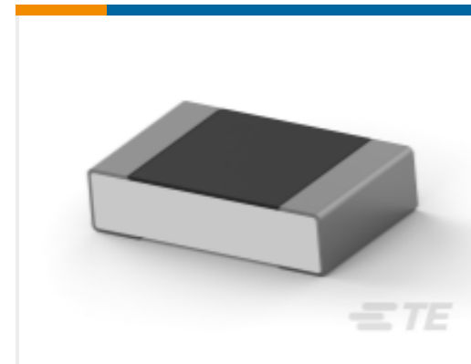
TE 产品编号4-2176374-5 RQ 0805 309R 0.1% 10PPM 1K RL