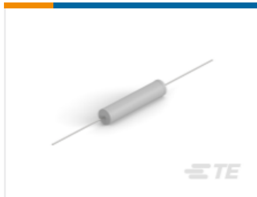
TE 产品编号2-2176415-9 8W STD M/OX 5% 430R