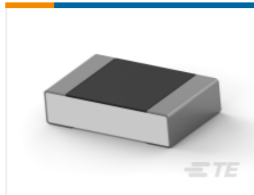
TE 产品编号4-2176374-5 RQ 0805 309R 0.1% 10PPM 1K RL