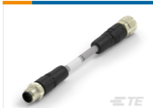
TE 产品编号TAA755A1611-080 M12A5-MS-FS-PVC-8.0M