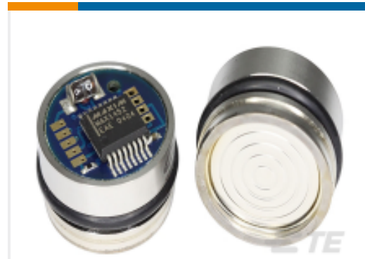
TE 产品编号86A3R-000000-100PG 100 PSIG ANALOG PRESSURE SENSOR