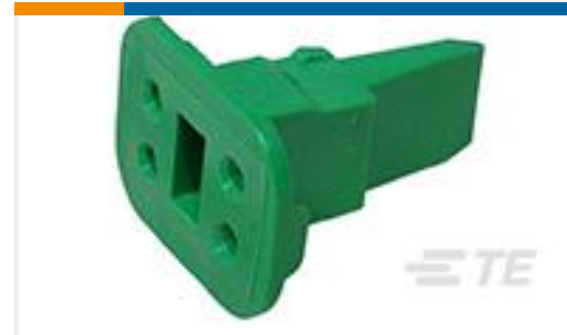
TE 产品编号W4S-P012 WEDGE LOCK, 4P, PLG, GRN, SL RET, DT