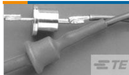
TE 产品编号5677554004 RNF-3000-1.5/0.5-0-SP