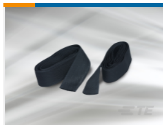
TE 产品编号CH01464002 HFT5000-4/2-0-SP