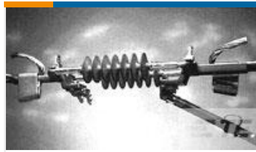
TE 产品编号83843-3 AMPACT ILD Replacement TAP 477.0