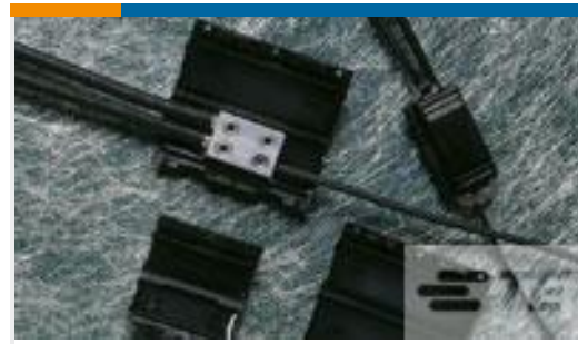
TE 产品编号888615-000 GTAP-1(B72)