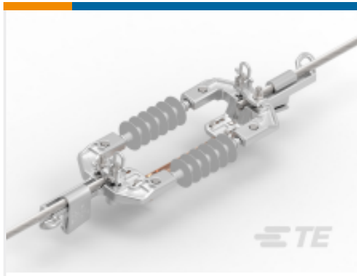
TE 产品编号1710722-3 15kILD-L-FRAME-KS9C