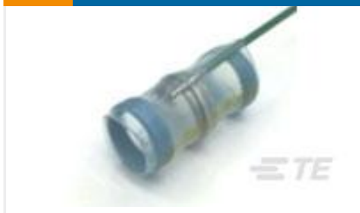
TE 产品编号695992-000 B-058-01