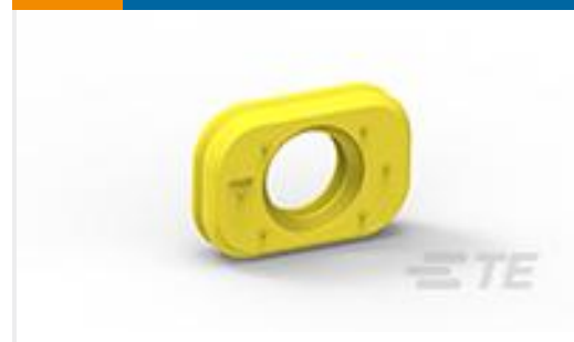
TE 产品编号2103154-1 CABLE SEAL, SIZE 1, HVA280