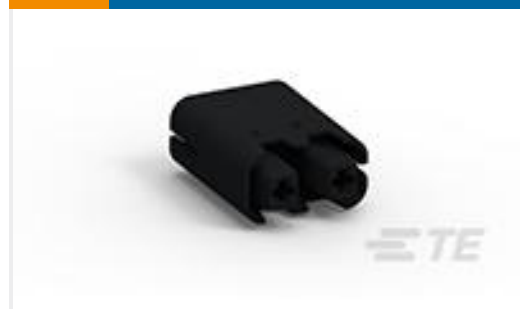
TE 产品编号1587977-2 INNER HOUSING, PLUG, HVA280- 2PHM, PASS T