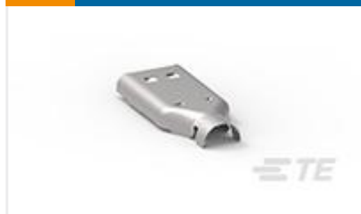
TE 产品编号2103157-1 SHIELD, PLUG, SIZE 1, Sn, HVA280