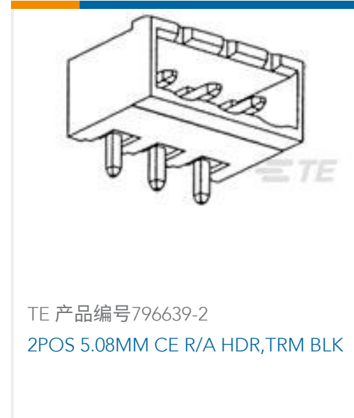
TE 产品编号796639-2 2POS 5.08MM CE R/A HDR,TRM BLK