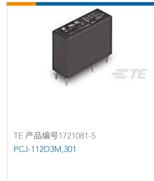
TE 产品编号1721081-5 PCJ-112D3M,301