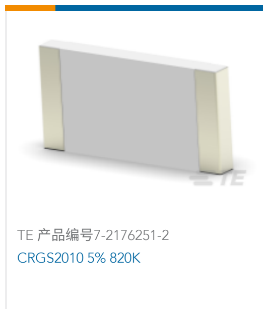
TE 产品编号7-2176251-2 CRGS2010 5% 820K