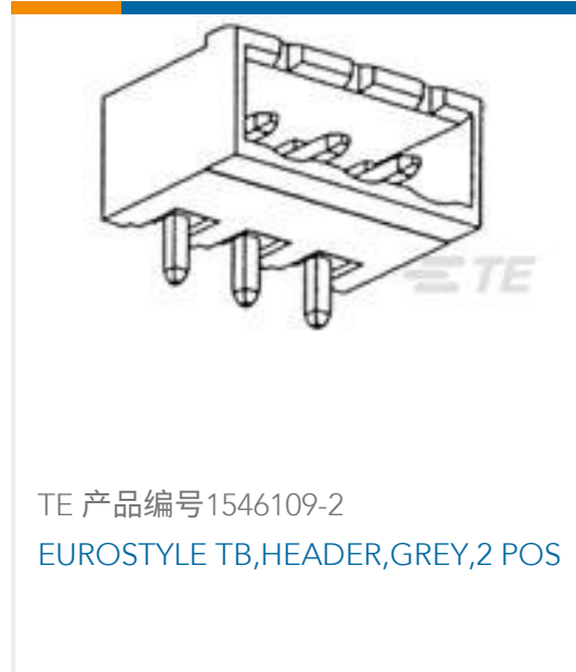
TE 产品编号1546109-2 EUROSTYLE TB,HEADER,GREY,2 POS