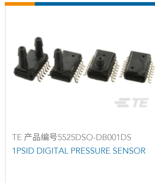
TE 产品编号5525DSO-DB001DS 1PSID DIGITAL PRESSURE SENSOR