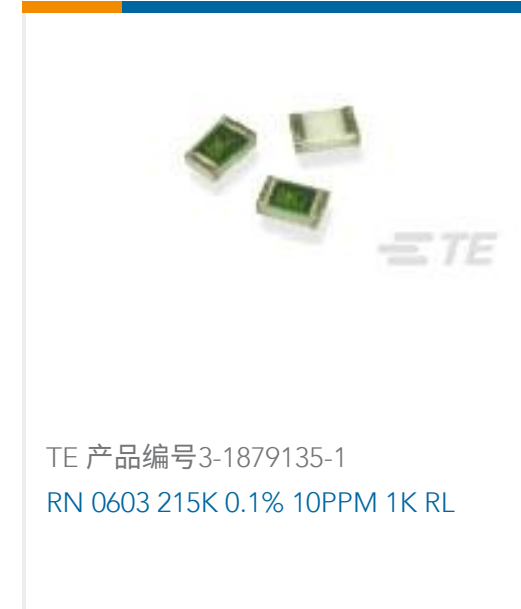
TE 产品编号3-1879135-1 RN 0603 215K 0.1% 10PPM 1K RL