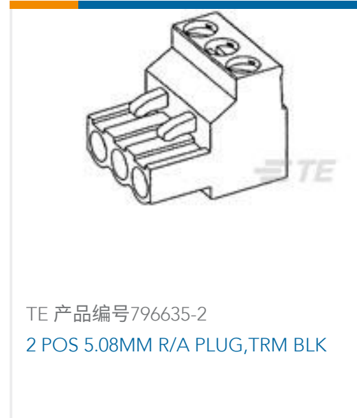
TE 产品编号796635-2 2 POS 5.08MM R/A PLUG,TRM BLK