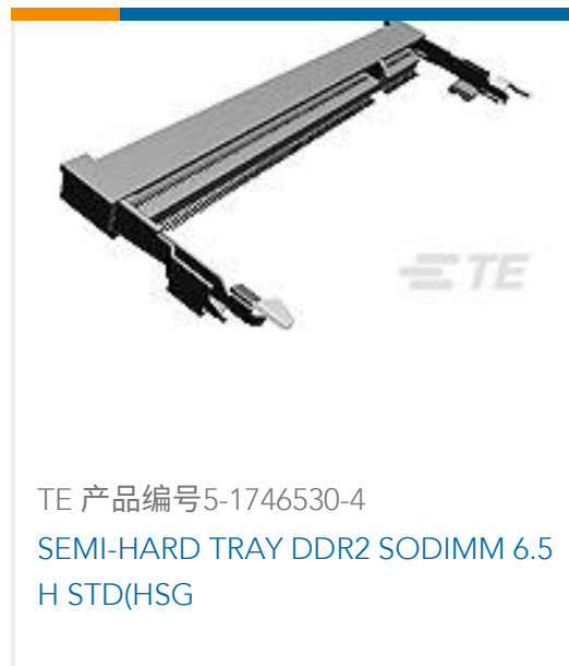
TE 产品编号5-1746530-4 SEMI-HARD TRAY DDR2 SODIMM 6.5 H STD(HSG)