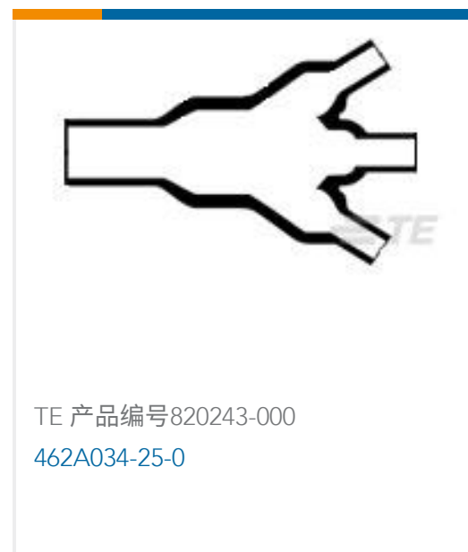
TE 产品编号820243-000 462A034-25-0