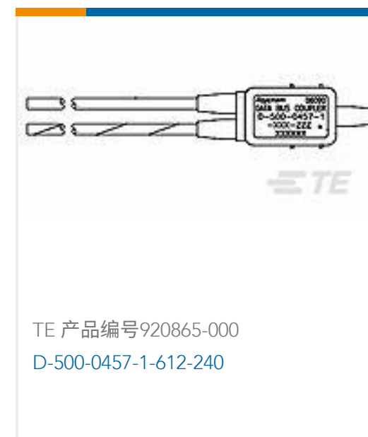
TE 产品编号920865-000 D-500-0457-1-612-240