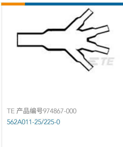
TE 产品编号974867-000 562A011-25/225-0