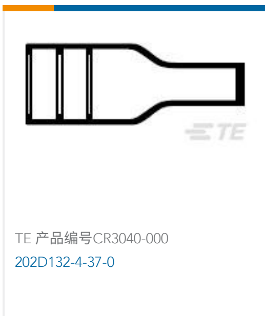
TE 产品编号CR3040-000 202D132-4-37-0