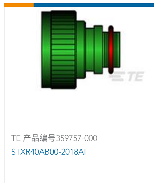
TE 产品编号359757-000 STXR40AB00-2018AI