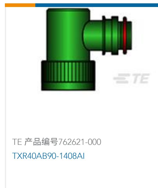
TE 产品编号762621-000 TXR40AB90-1408AI