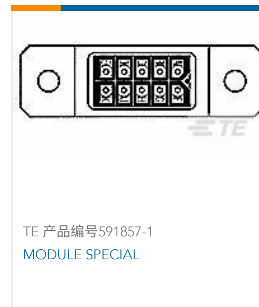
TE 产品编号591857-1 MODULE SPECIAL