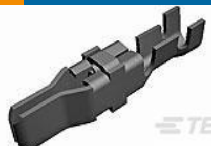
TE 产品编号66259-2 MALE CONTACT ASSY. (L.P.)