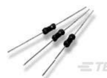
TE 产品编号1625890-6 2W SM M/OX 5% 10R