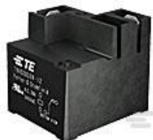
TE 产品编号5-1419102-2 T9AP5D52-2