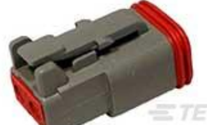
TE 产品编号DT06-2S PLG, 2P, GRY, N