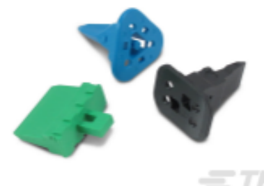
TE 产品编号W2S Wedgelocks: DEUTSCH DT