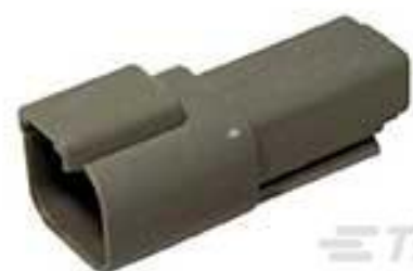
TE 产品编号DT04-2P REC, 2P, GRY, N