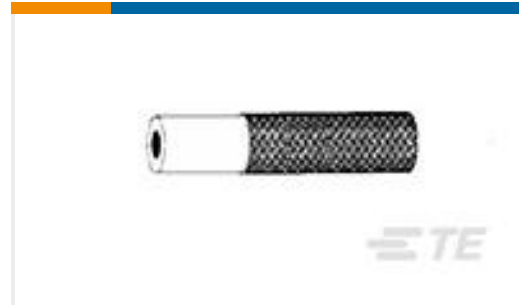
TE 产品编号0059013002 RAY-101-20.0(50)