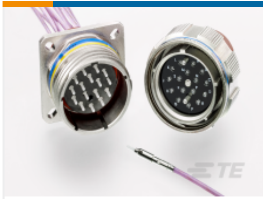
TE 产品编号YMC8017-F-11-02PN0 ARINC 801, TYPE 1 JAM NUT CONNECTOR