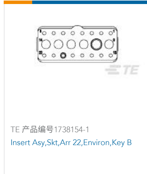
TE 产品编号1738154-1 Insert Assy, Skt, Arr 22, Environ, Key B