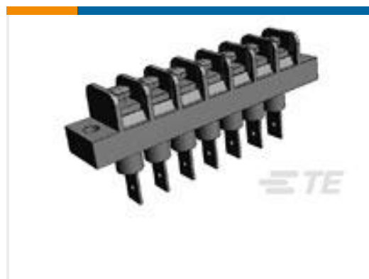
TE 产品编号5-1437665-6 JC6-Q307-07=JC6 ASSEMBLY