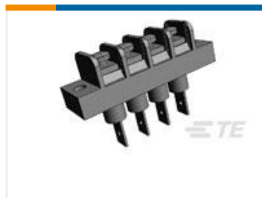
TE 产品编号6-1437665-5 JC6-Q308-04=JC6 ASSEMBLY