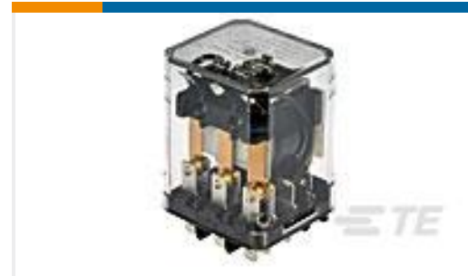
TE 产品编号1-1393118-8 KUP-14D15-6=KU