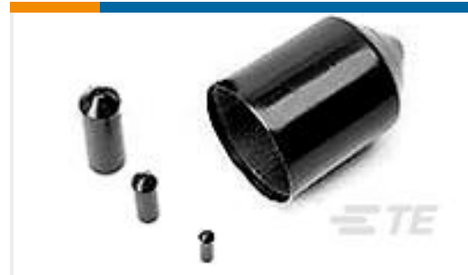
TE 产品编号843222-000 101A021-3/42-0