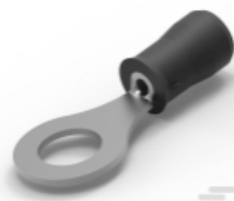
TE 产品编号324915 PIDG Ring Tongue Terminals