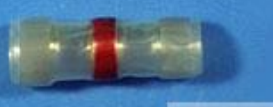
TE 产品编号448859-000 D-1744-01