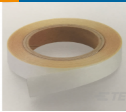
TE 产品编号 890060-000 S1017-1.0X50