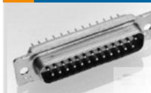
TE 产品编号205558-2 AMPLIMITE,ASY,PLUG,STD,109,2