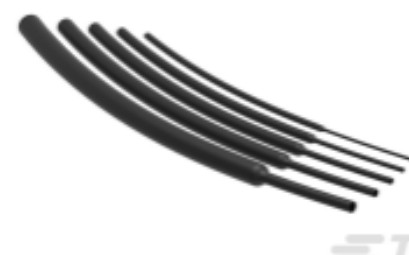
TE 产品编号NB18932001 RNF-100-1/4-BK-STK