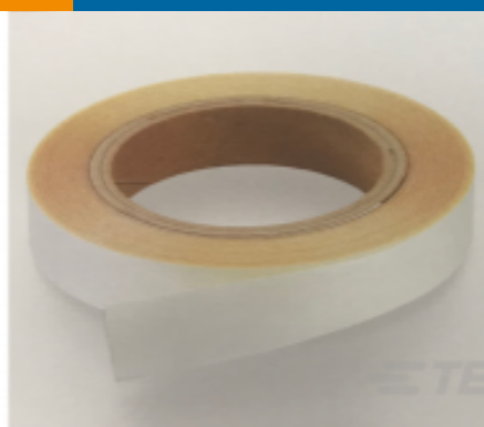
TE 产品编号 890060-000 S1017-1.0X50