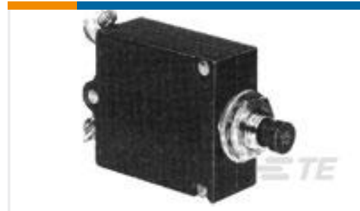
TE 产品编号7-1393246-1 W23-X1A1G-30=W23/W31