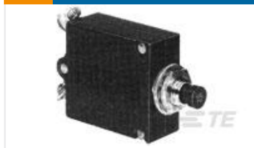
TE 产品编号7-1393246-6 W23-X1A1G-50=W23/W31