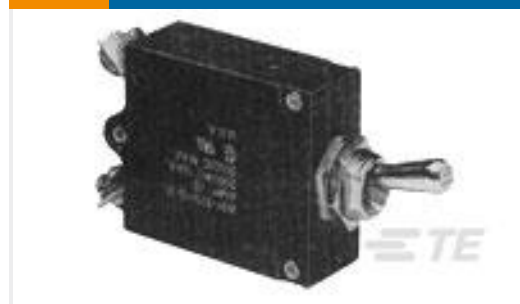
TE 产品编号3-1393247-5 W31-X2M1G-20=W23/W31