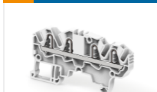
TE 产品编号1SNK705012R0000 ZK2.5-4P