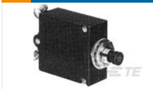
TE 产品编号7-1393246-5 W23-X1A1G-5=W23/W31-