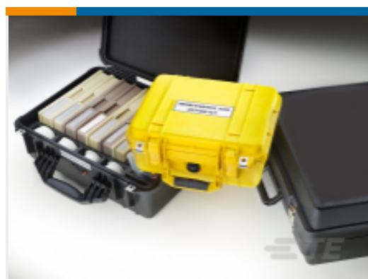
TE 产品编号312053-000 HRM/01-2117