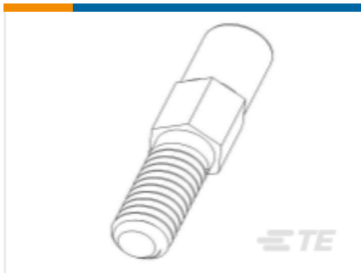
TE 产品编号65022-003 JUNCTION ASSY