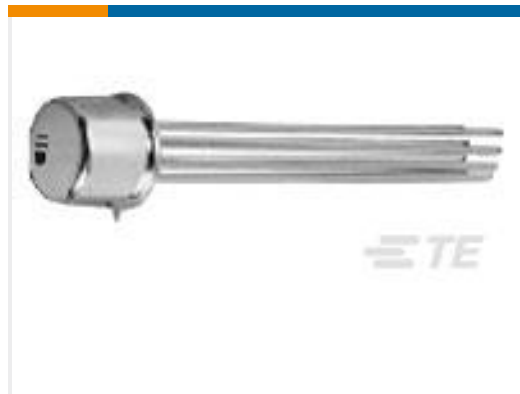
TE 产品编号1-1617351-0 JMACDG-18XP=M39016/15-092P