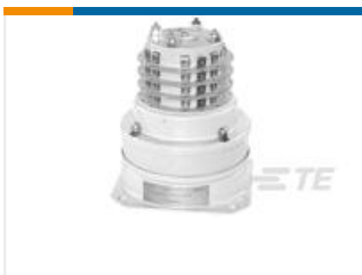
TE 产品编号1-1393139-9 MDR-170-2=MDR