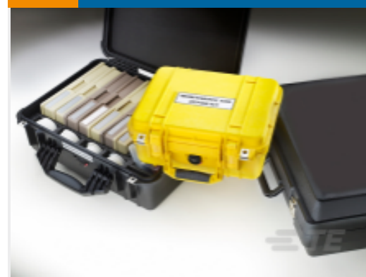
TE 产品编号A12306-000 MK-0020-105-DATABUS