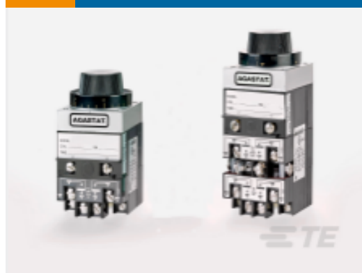
TE 产品编号1423183-7 7032CDD=RLY,STD,DBH,2P,480VAC