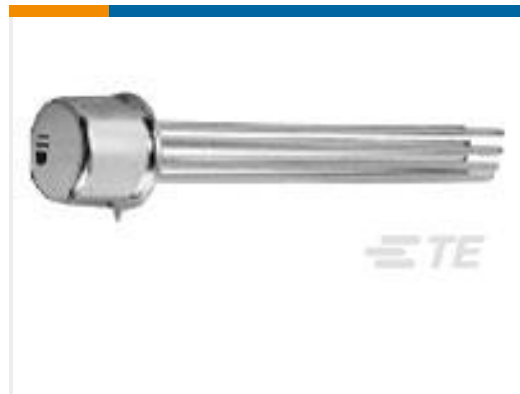
TE 产品编号1617165-1 JMAWDD-12XP = M39016/20-010P