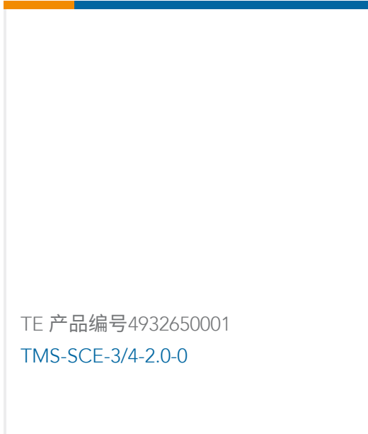
TE 产品编号4932650001 TMS-SCE-3/4-2.0-0