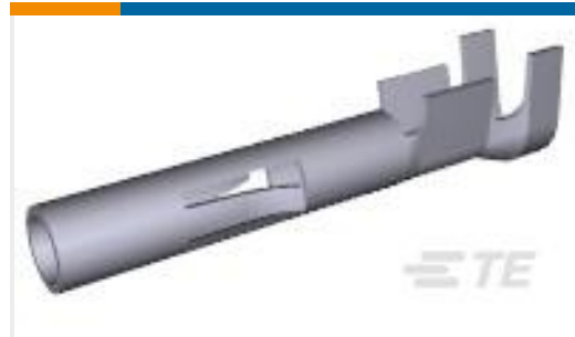
TE 产品编号350550-6 UMNL SOK 20-14 AU/PHBZ L/P