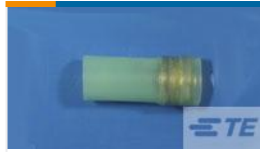
TE 产品编号528006N001 D-150-1006CS821