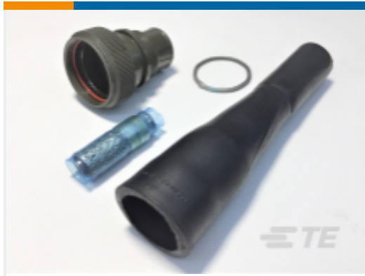
TE 产品编号571823N001 6120-10-561120-CS2359