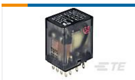
TE 产品编号4-1393122-3 KHAU-17D11-12=KH