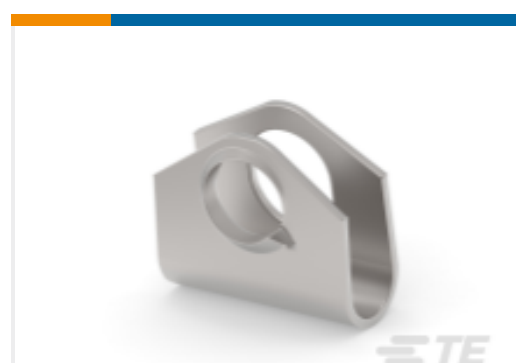
TE 产品编号745564-1 SCREW RETAINER CLIP,AMPLIMITE