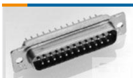
TE 产品编号1757823-7 AMPLIMITE,ASY,PLUG,STD,90,ZN,1,CT