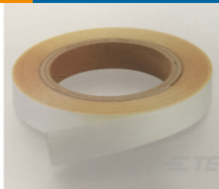
TE 产品编号 890060-000 S1017-1.0X50