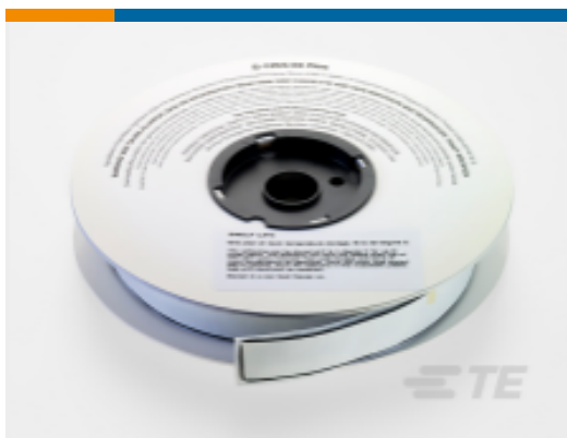
TE 产品编号 195133-000 S1255-04-3/4X100FT