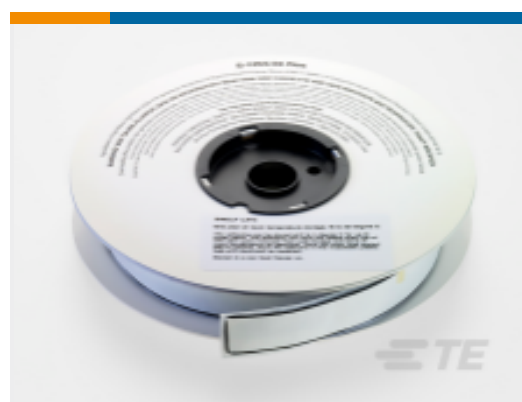
TE 产品编号 195133-000 S1255-04-3/4X100FT