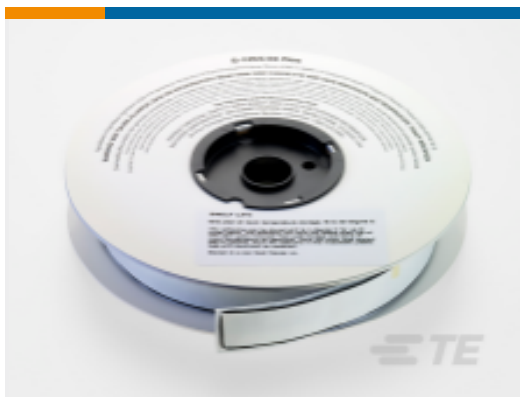
TE 产品编号 195133-000 S1255-04-3/4X100FT