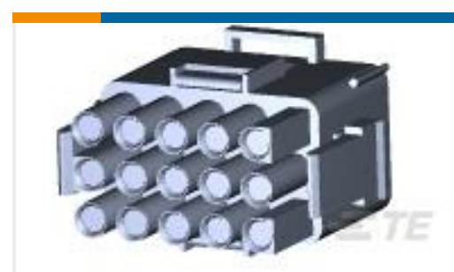
TE 产品编号770023-1 15P UMNLI IN-LNE PLUG HSG KIT