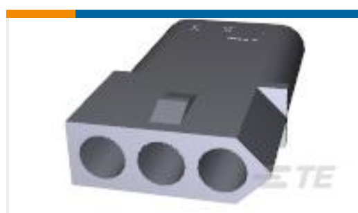
TE 产品编号770070-1 03P .093 COMM P&S RECPT HSG