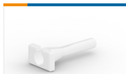
TE 产品编号114009-ZZ EXT TOOL, SIZE 4, 6 AWG, N, WHT