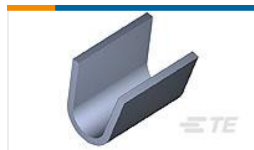
TE 产品编号61299-2 SPLICE 7000-12500 .032 TPBR