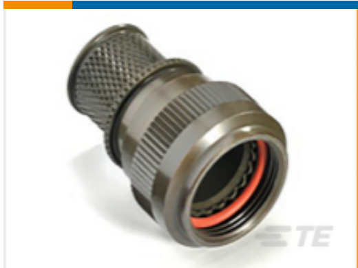
TE 产品编号BTF1-09-04-1-C BTF1-09-04-1-C