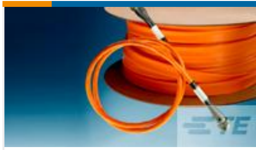
TE 产品编号CP2527-000 RT-780-3/8-3-SP