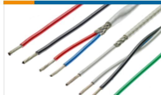
TE 产品编号3827113001 44A1121-20-2/9-9