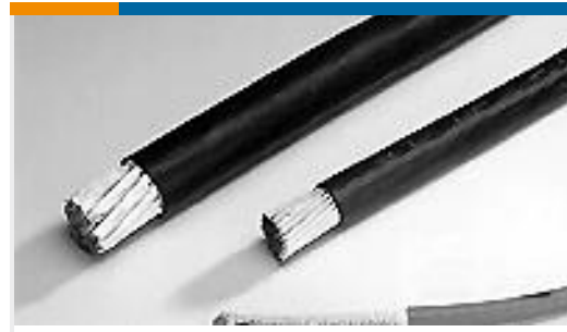
TE 产品编号C433953001 VG-95218-T020-G129