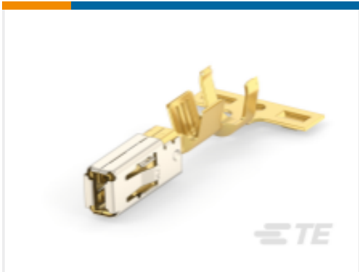
TE 产品编号1-968857-2 AMP MCP 2.8, CONTACT SWS