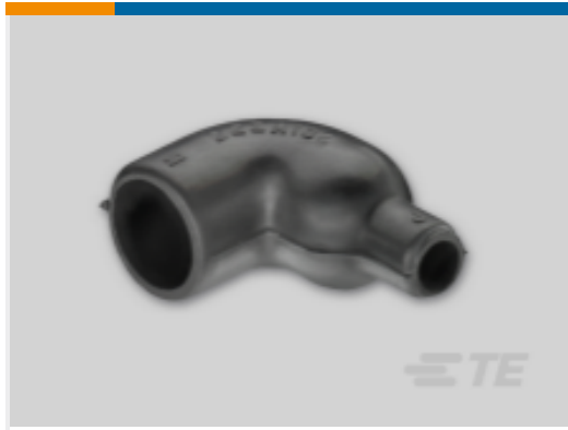
TE 产品编号814717-000 热缩护套：无嘴，直角