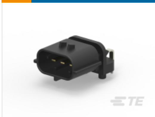
TE 产品编号1-345361-1 3 WAY HDR FOR ECONOSEAL 3STRAI