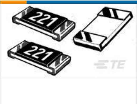
TE 产品编号2-2176231-1 3522 68R 1% 3W