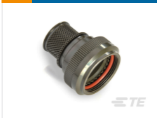
TE 产品编号EK4826-000 91H1-09-04-1-ZN-HE050