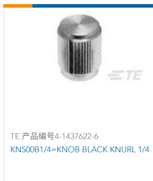
TE 产品编号4-1437622-6 KN500B1/4=KNOB BLACK KNURL 1/4