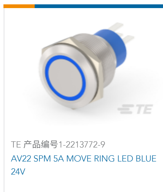
TE 产品编号1-2213772-9 AV22 SPM 5A MOVE RING LED BLUE 24V