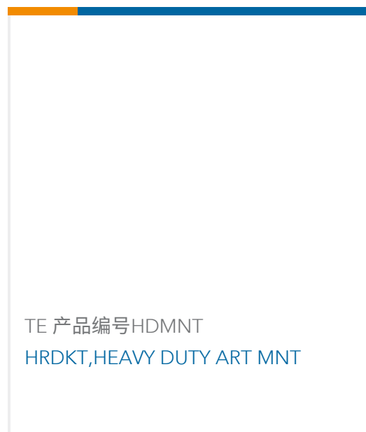
TE 产品编号HDMNT HRDKT,HEAVY DUTY ART MNT