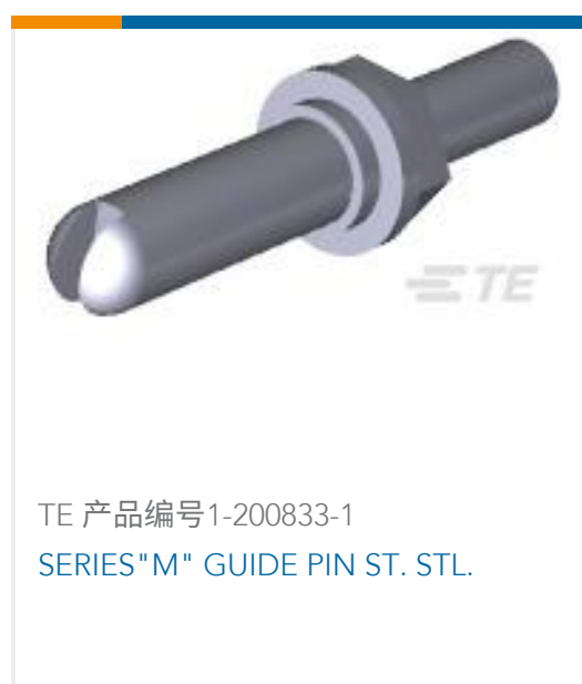
TE 产品编号1-200833-1 SERIES "M" GUIDE PIN ST. STL.