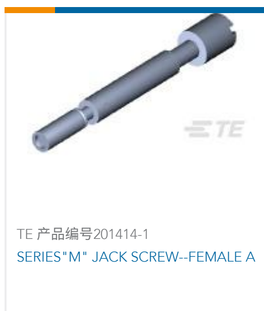
TE 产品编号201414-1 SERIES "M" JACK SCREW--FEMALE A