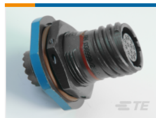
TE 产品编号YDTS24Z17-26PNV001 RECP ASSY