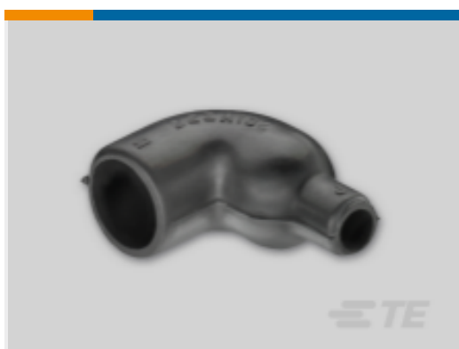
TE 产品编号878514-000 球形热缩护套：有嘴，直角