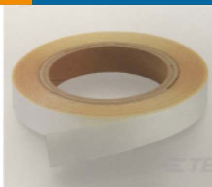
TE 产品编号 890060-000 S1017-1.0X50