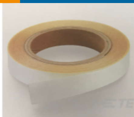
TE 产品编号 890060-000 S1017-1.0X50