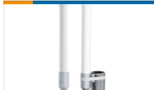
TE 产品编号OC69271-FNF OMNI,DBAND,FIXED,NF 698-960MHz, 1.5dBi