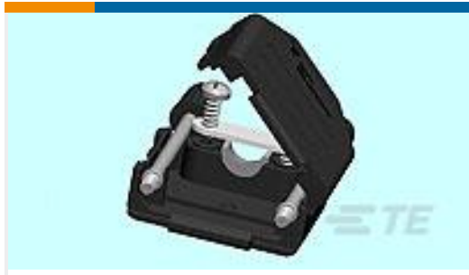
TE 产品编号1991253-9 9 WAY LOW COST D SUB BACKSHELL