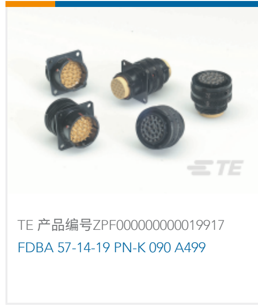
TE 产品编号 ZPF00000000019917 FDBA 57-14-19 PN-K 090 A499