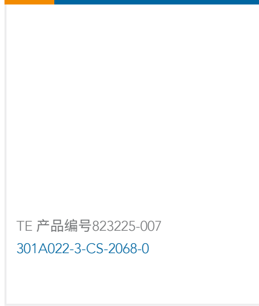
TE 产品编号 823225-007 301A022-3-CS-2068-0