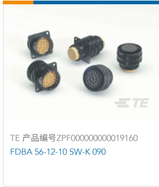
TE 产品编号 ZPF00000000019160 FDBA 56-12-10 SW-K 090