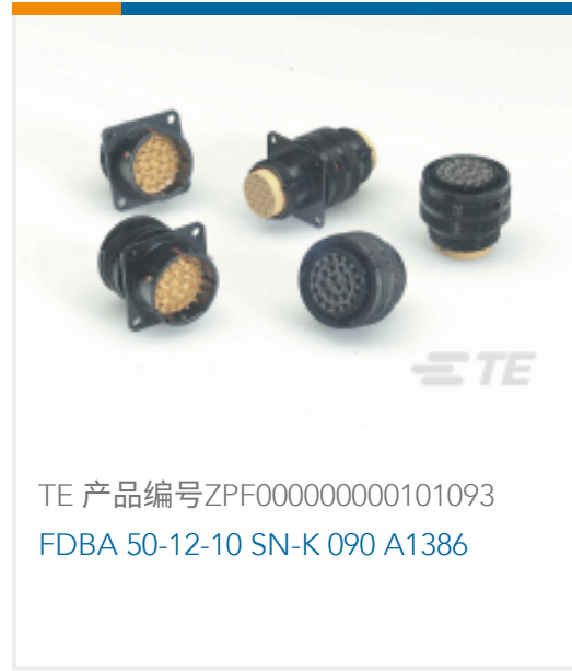
TE 产品编号 ZPF00000000101093 FDBA 50-12-10 SN-K 090 A1386