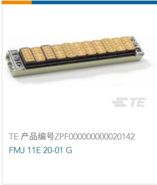
TE 产品编号 ZPF00000000020142 FMJ 11E 20-01 G