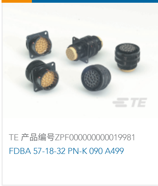
TE 产品编号 ZPF00000000019981 FDBA 57-18-32 PN-K 090 A499