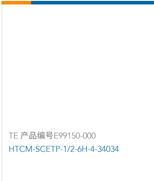
TE 产品编号 E99150-000 HTCM-SCETP-1/2-6H-4-34034