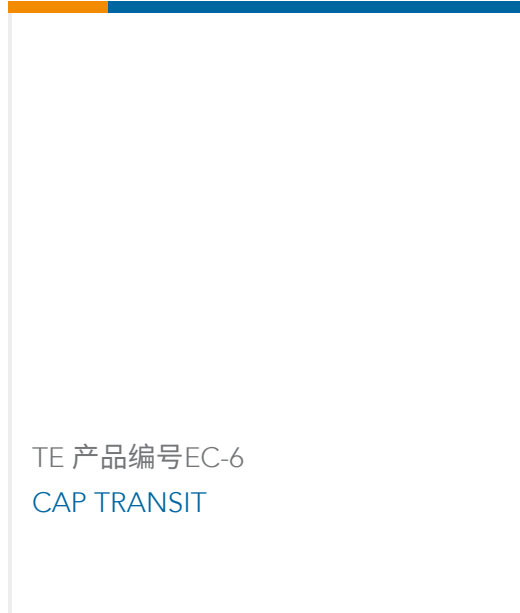
TE 产品编号EC-6 CAP TRANSIT