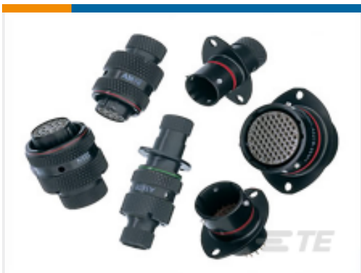
TE 产品编号AS624-61SN PLUG BOOT TERMIN'N TYPE 6