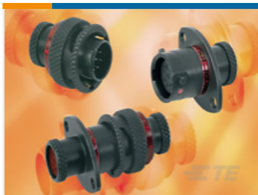
TE 产品编号ASDD106-09SA-HE INLINE RECEPT ASSY. ASDD 9 WAY.