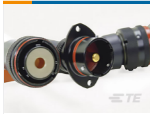
TE 产品编号ASHD014-1SN-C25 RECEPT.100A.2 HOLE MTG.25MM SKT