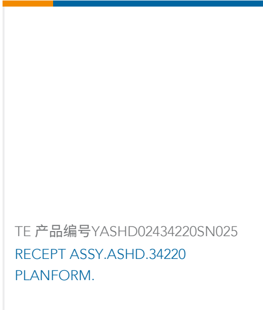
TE 产品编号YASHD02434220SN025 RECEPT ASSY.ASHD.34220 PLANFORM.