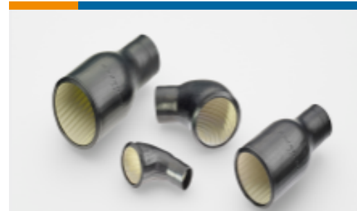
TE 产品编号EK7313-000 222S163-100C-0