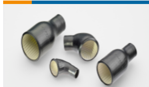
TE 产品编号EK7308-000 222S142-100C-0