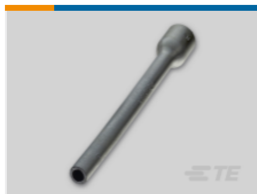
TE 产品编号510715-000 小尺寸热缩护套：聚合物成型，有嘴，直形