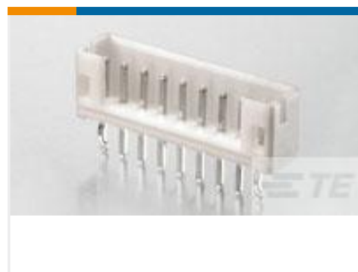
TE 产品编号440054-6 2.0MM,HDR,6POS,VERTICAL