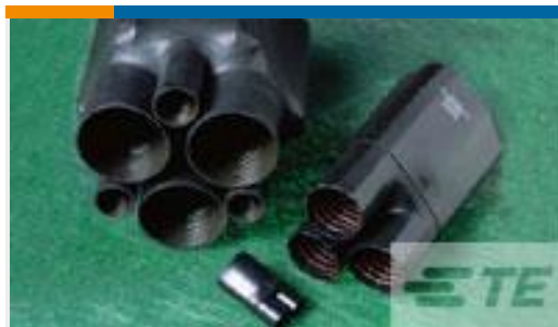
TE 产品编号094307-000 CBR-4-1-A-(B3)