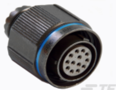
TE 产品编号YDTS26W13-04PNV001 PLUG ASSY